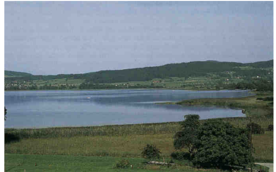
Blick über den Pfäffikersee: Ganz langsam scheint sich auch die Situation unter der Wasseroberfläche zu verbessern.

Bei Erreichen der Geschlechtsreife zieht es die Seeforellen wie die Lachse in ihre Geburtsgewässer. Dabei werden je nach Gewässer zum Teil lange Laichwanderungen unternommen. Die Seeforellen des Brienersees etwa ziehen die Hasliaare bis weit ins Haslital hinauf oder wandern die Lütschine bis nach Lauterbrunnen hoch. Ein Teil der