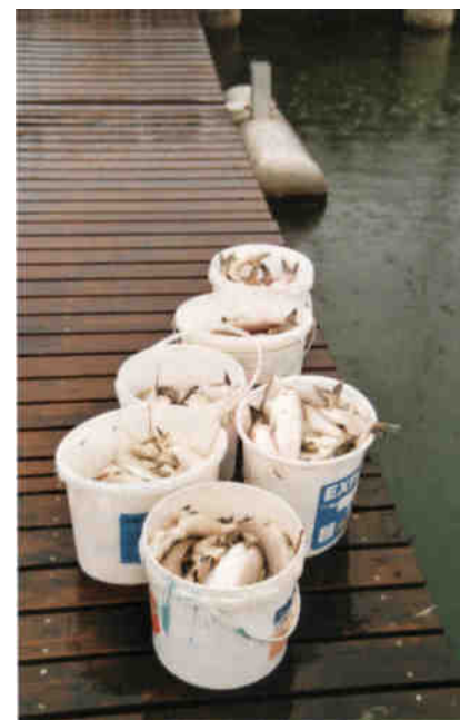
Kübelweise tote Felchen. Das Fischsterben vom vergangenen Jahr bleibt ungeklärt.

Der Laie fragt sich jetzt, warum es seit der Einführung der mehrstufigen Kläranlagen trotz der stark gesunkenen externen Nährstoffeinträge im Sommer weiterhin zu Problemen mit dem Sauerstoffhaushalt im Hypolimnion kommt. Die Ursache dafür sind die Nährstoff-Altlasten im See selbst. Die im Sediment abgelagerten, wegen des sommerlichen Sauerstoffmangels unvollständig abgebauten Nährstoffe lösen sich ins überstehende Wasser zurück und düngen den See somit von unten! Der gefährliche Kreislauf wird so seeintern noch jahrelang in Gang gehalten.