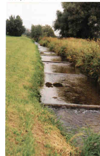
Der Chämtnerbach zwischen Kempten und Auslikon: Ein trostlos strukturarmes Gerinne. Bei Niederwasser ist es für aufwärtswandemde Fische schlecht zu passieren. Eine mäandrierende Niederwasserrinne mit Stein- und Holzstrukturen würde auch als Lebensraum für Fauna und Flora viel bringen.

Windrichtung und seeinternen Strömungen in ihrer Tiefenausdehnung innerhalb eines Sees wesentliche Unterschiede zeigen können. Anders kann man sich eigentlich nicht erklären, dass sich im Pfäffikersee seit Jahren ein hervorragender Felchenbestand halten kann. Da Felchen bezüglich der Sauerstoff- und Temperaturansprüche mit den Forellen vergleichbar sind, ist anzunehmen, dass bei deren Überleben auch die Forellen eine reelle Chance haben, einen natürlichen Bestand