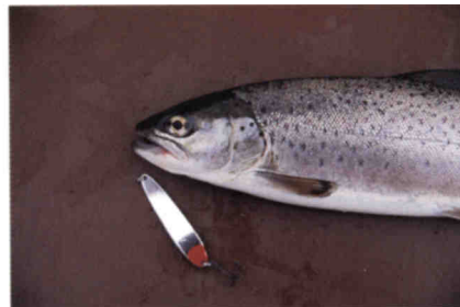
Der Fang einer Pfäffikerseeforelle wird auch nach einer erfolgreichen Wiedereinbürgerung etwas Besonderes bleiben.

auf und können trotzdem nur eine unvollständige Zersetzung durchführen: Es bildet sich grauschwarzer, methan-, ammoniak- und schwefelwasserstoffhaltiger Faulschlamm anstelle eines vollständig mineralisierten hellen Sediments. Wenn der lebenswichtige Sauerstoff im Hypolimnion fehlt, müssen die Fische ins warme Epilimnion ausweichen. Für warmwasserliebende Arten eigentlich kein Problem. Anders sieht es mit den Felchen und Forellen aus; ihr Stoffwechsel ist auf kühles Wasser angewiesen.