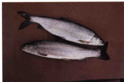
Ein Bild mit grossem Seltenheitswert: Die beiden Edelfischarten des Pfäffikersees auf einem Bild; oben einer der zahlreichen Felchen und unten eine der raren Pfäffikerseeforellen. Werden die letzteren bald häufiger?

Grosse Mengen von Totmaterial, wie sie in überdüngten Gewässern anfallen, benötigen aber mehr Sauerstoff zum Abbau als während der warmen Jahreszeit im Hypolimnion zur Verfügung steht: Die abbauenden Bakterien brauchen allen Sauerstoff